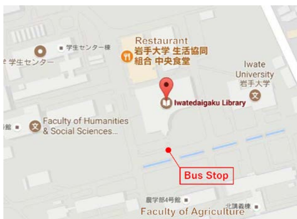
岩手大学図書館前臨時停留所

第3便 日 時：9月24日（日曜日） 16：00 乗車場所： 盛岡駅 西口バスターミナル 28番乗り場付近 バ ス：八幡平ロイヤルホテル手配バス（J-Physics2017 専用） 定 員：50名