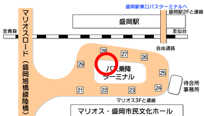
盛岡駅 西口バスターミナル 28番乗り場付近